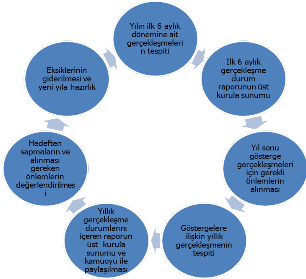
Şekil 1. Stratejik Plan İzleme ve Değerlendirme Şeması

Yıllık planın uygulanmasında yürütme ekipleri ve eylem sorumlularıyla aylık ilerleme toplantıları yapılacaktır. Toplantıda bir önceki ayda yapılanlar ve bir sonraki ayda yapılacaklar görüşülüp karara bağlanacaktır.